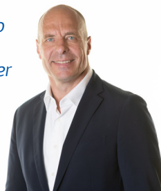
Thomas Amstutz CEO di Feldschlösschen

«Sia che si tratti di birra lager, bianca o analcolica, gli ingredienti più importanti per un prodotto di qualità sono materie prime selezionate, competenza e passione.»